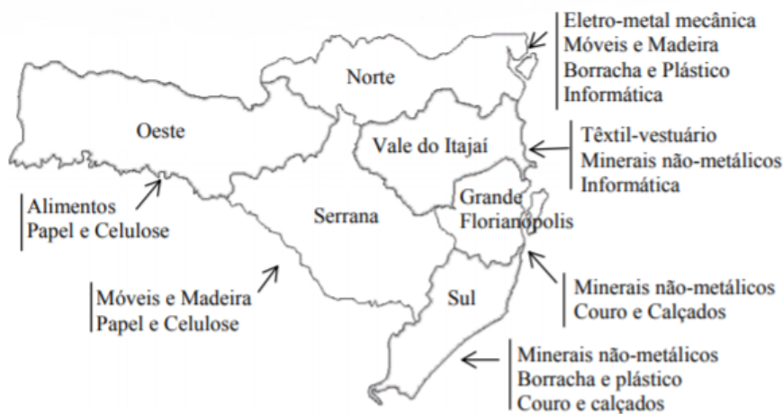
Figura 1: Incidência espacial de setores selecionados da indústria de Santa Catarina - principais áreas de concentração em 2005