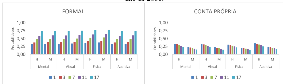
Gráfico 1 – Cenários das probabilidades dos deficientes com base no nível de escolaridade para o ano de 2000.