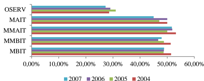
Figura 2 – Efeitos de política de câmbio real mínimo sobre as exportações.

A depreciação da taxa de câmbio real incentiva o crescimento das exportações (Figura 2). Os setores de manufaturas e de serviços registram expressivo crescimento com a manutenção de uma política cambial competitiva. Quando se analisa a composição setorial relativa das exportações, verifica-se que os segmentos industriais aumentam em aproximadamente 18% a sua participação no total exportado. As importações registram variações positivas, porém acompanham o ritmo de crescimento do produto.